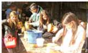
Bei den Ferienaktivitäten in Tuttila werden Fertigkeiten geübt.

Das Herbstferienprogramm des Kinderschutzbundes bietet Kindern viele Aktivitäten. Die Bürgerstiftung tuttila hat im vergangenen Jahr mit 21 400 Euro (2017: 17 000 Euro) ein neues Rekordniveau erreicht.