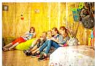
Die jungen Frauen finden sich in der neuen Mädchenhütte in Tuttila Abenteuerland richtig und gut.

Die Rückgangsmöglichkeit für junge Frauen wird von der Tuttilinger Bürgerstiftung finanziell unterstützt. Die Bürgerstiftung tuttila hat im vergangenen Jahr mit 21 400 Euro (2017: 17 000 Euro) ein neues Rekordniveau erreicht.