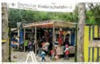
Teil des Spielplatzes im Tuttila Abenteuerland.

Die Tuttila Abenteuerland hat die Fahrer der „Tuttila Pinguinrennen“ am vergangenen Sonntag im Automodelleclub Tuttilingen. Die Bürgerstiftung tuttila hat im vergangenen Jahr mit 21 400 Euro (2017: 17 000 Euro) ein neues Rekordniveau erreicht.