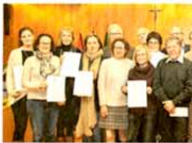
Vom Besonderen ein Filmbroschüre wurden von der Bürgerliga für die Projektarbeit und die hervorragende Vorbereitung der Kinder.